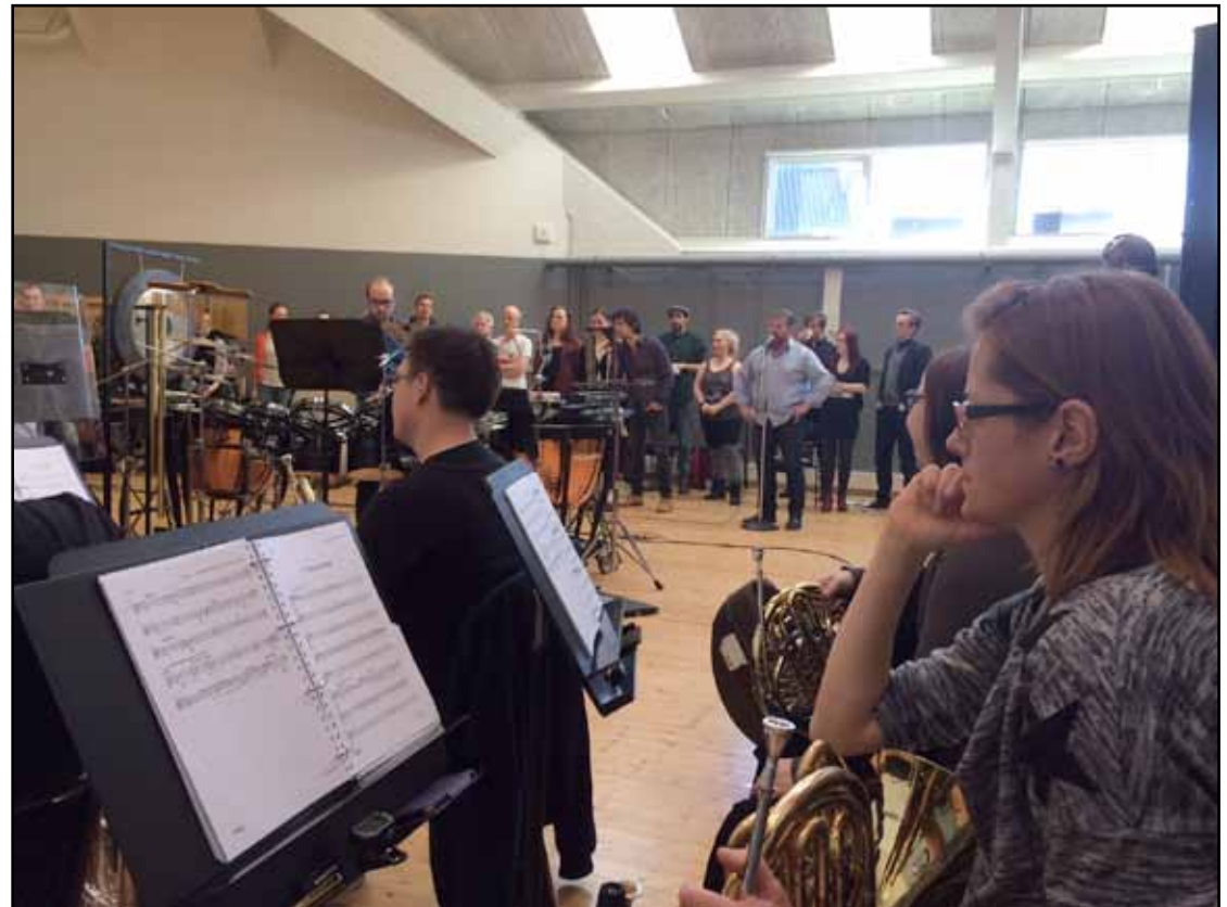
Fra Sitzproben 12. marts (første møde mellem alle skuespillere og orkestret)