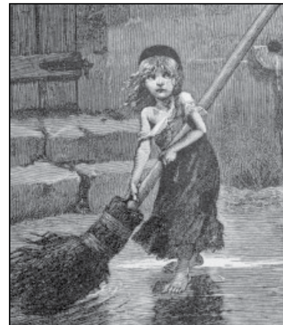
Original illustration af Cosette, som siden er blevet ikon for Les Misérables på scene og film