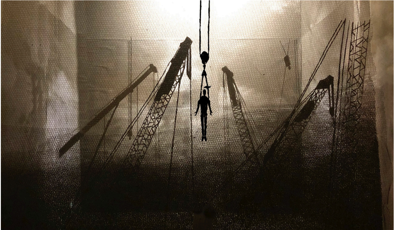
Scenografi-tegning af Julian Juhlin