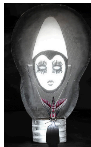
Scenografi-tegning af Julian Juhlin

Og når om morgenen solen skinner, da vågner de med små røde kinder, og takke Gud for, hvad de har drømt, og kysse fader og moder ømt.