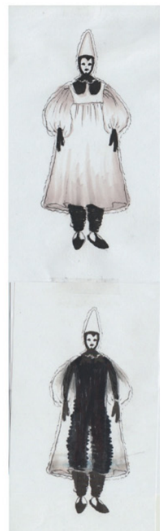
Kostume-tegning af Julian Juhlin