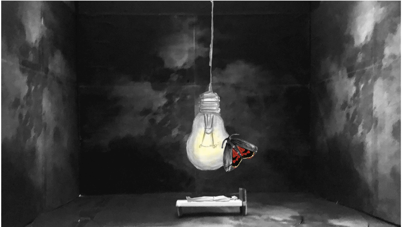
Scenografi-tegning af Julian Juhlin