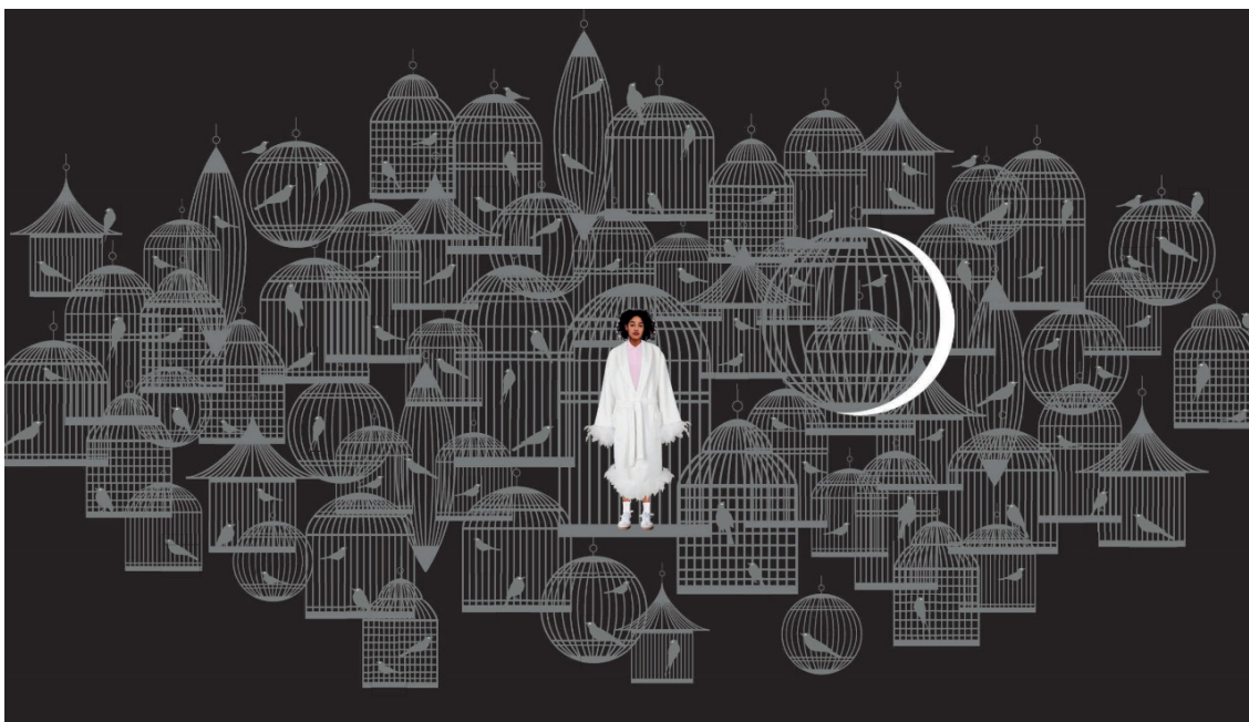
Scenografi-tegning af Julian Juhlin

Ofte vil I opleve under den efterfølgende fælles forestillingsanalyse, at jeres fokuspunkter griber ind i hinanden – lad dem! Det er netop, fordi det er selve helhedsoplevelsen af forestillingen med alle de udtryk, tanker, sansninger, følelser og iagttagelser, den giver anledning til, der er central for analysen.