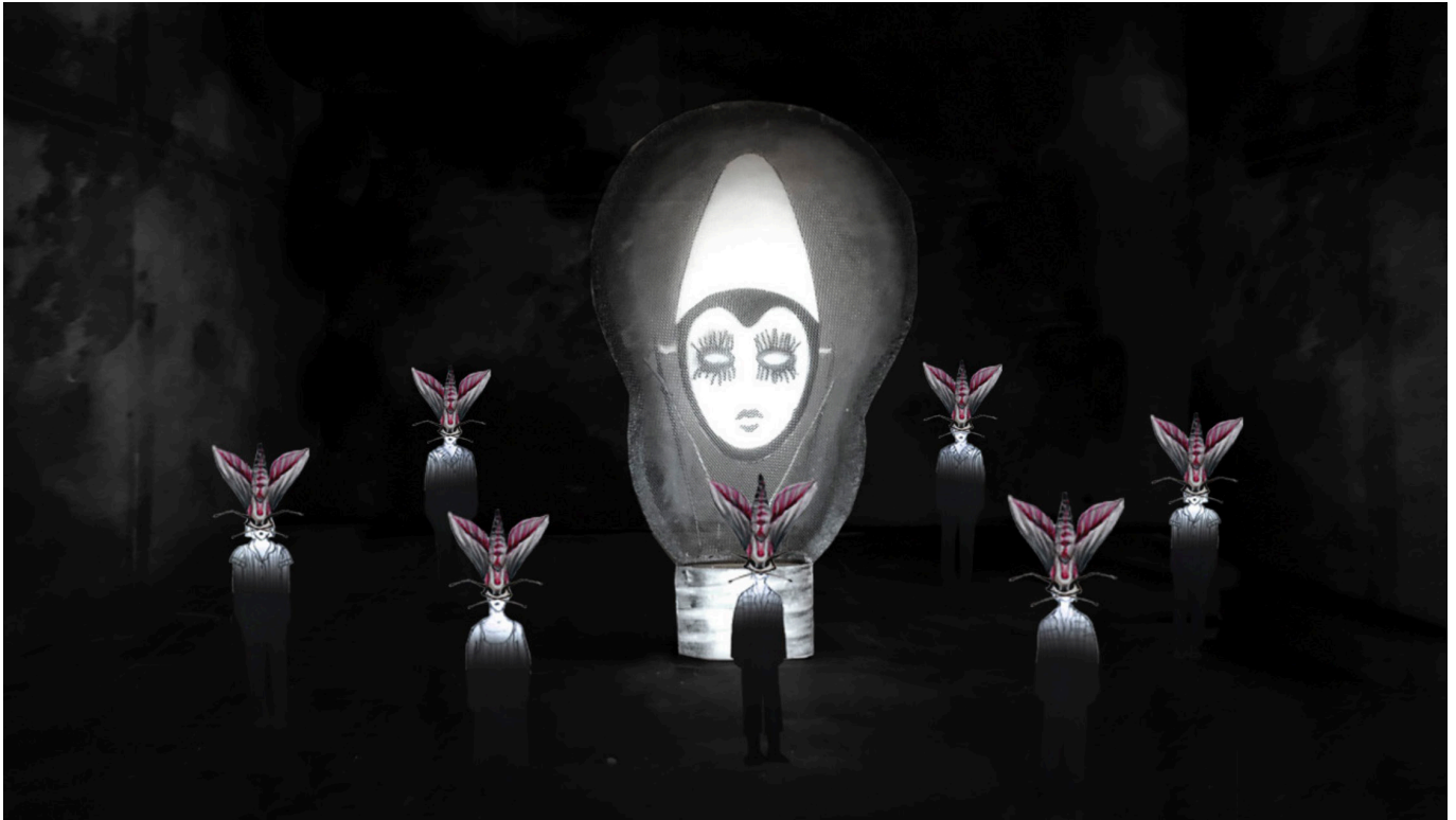
Scenografi-tegning af Julian Juhlin