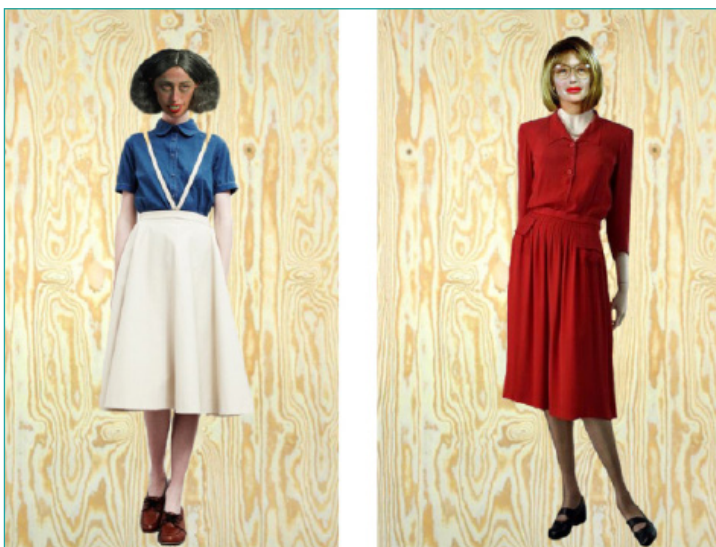
Scenografi og kostumer: David Gehrt