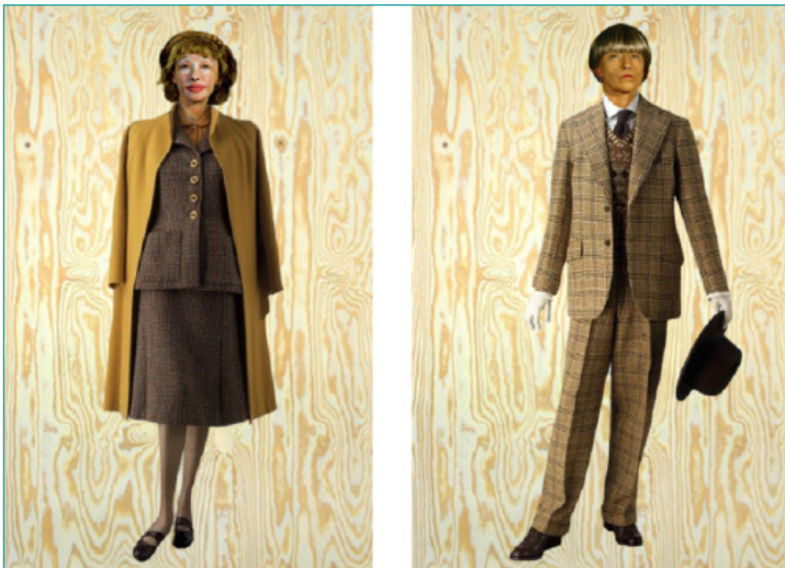
Scenografi og kostumer: David Gehrt