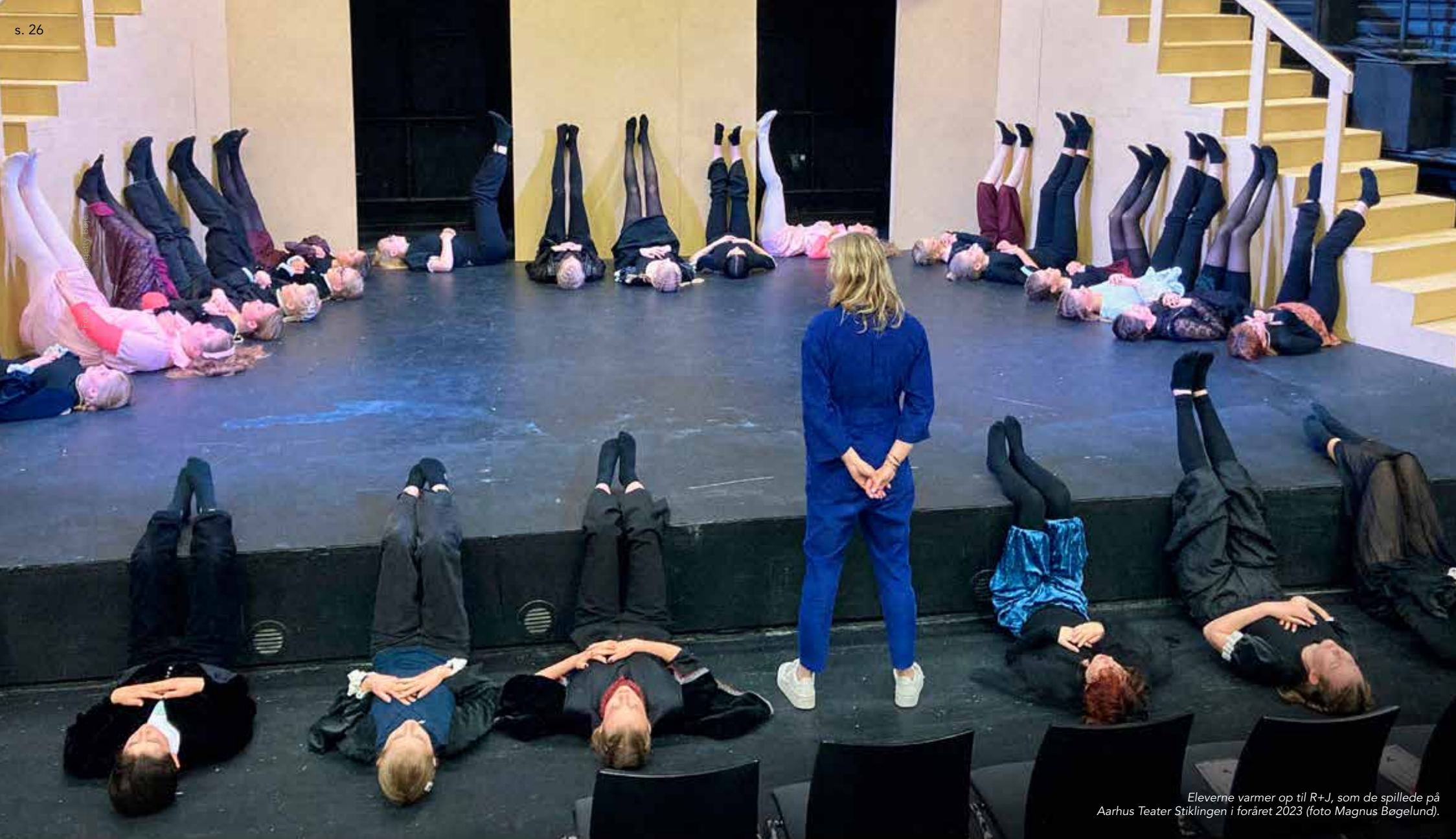
Eleverne varmer op til R+J, som de spillede på Aarhus Teater Stiklingen i foråret 2023.