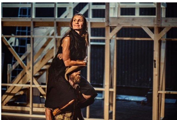
Den vægelsindede

På Scala lagde vi ud med Holbergkomedien Den vægelsindede om kvinden Lucretia, der skifter mening, som vinden blæser til stor forvirring for folk omkring hende, men også til stor underholdning for publikum. Som vi demonstrerede med Erasmus Montanus , er Holberg på en gang både kulturarv og samfundsaktuel; i en hverdag hvor alle muligheder står åbne, og alt er til forhandling, er Lucretia vores allesammens sjæleven.