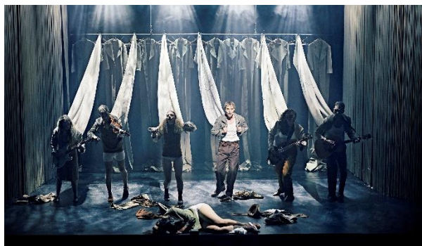
Teaterkoncert C.V. Jørgensen

Reumertnomineret urpremiere i co-produktion med Aveny-T, hvor forestillingen spiller i foråret 2022.