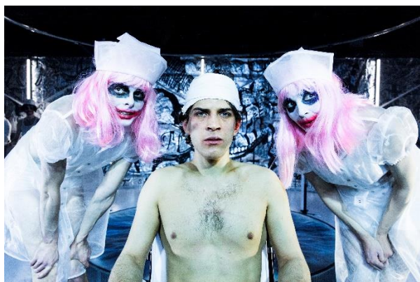
A Clockwork Orange

Anmelderost urpremiere på ny dramatisering af Bjørn Rasmussen iscenesat af huskunstner Nathalie Mellbye.