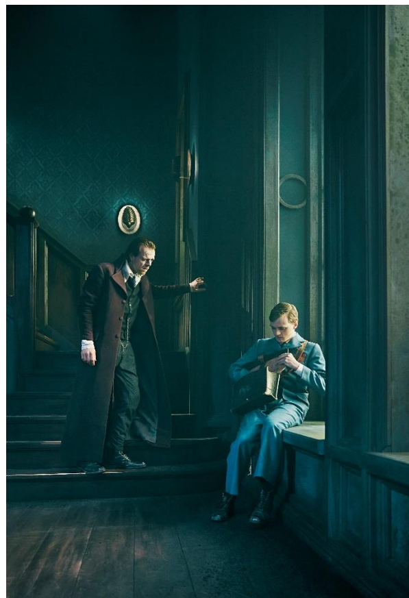
Et Juleeventyr

Danmarkspremiere på den britiske succes-dramatiker Jack Thorne's adaptation af Charles Dickens' elskede julefortælling.