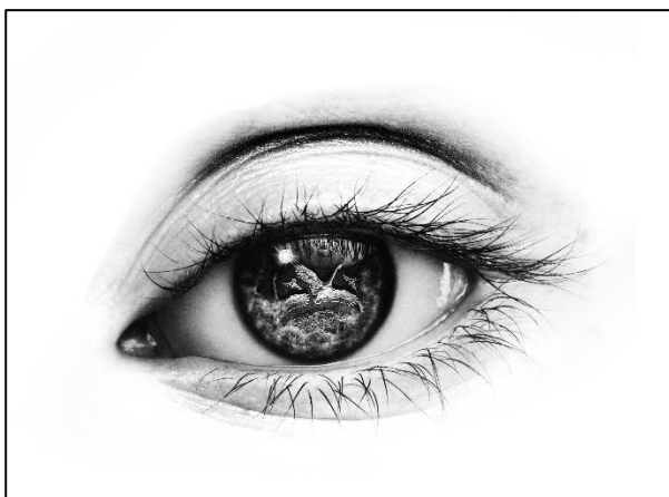
Sæson 21/22 forside foto

Det var med stor optimisme, vi åbnede teatersæsonen 2020/21 efter den lange corona-nedlukning i foråret 2020. Selvom vi kun kunne besætte hvert andet sæde, og vi måtte ændre i forestillingerne, så de kunne holde sig indenfor de restriktioner corona-epidemien krævede, var glæden nærmest euforisk - både på scenen og i salen - da Teaterkoncert C.V. Jørgensen havde premiere på Store Scene. Forestillingen skulle have haft premiere på Aveny T i maj 2020, men kort efter prøvestart blev Danmark lukket ned. Efter en turbulent proces, hvor prøverne på forestillingen bl.a. foregik hjemmefra over nettet, blev det klart, at produktionen ikke ville kunne nå at få premiere i København. Derfor planlagde vi hurtigt en ekstra prøveperiode i Aarhus, og kunne fejre en flot premiere i august. Forestillingen blev nomineret til en Reumert for årets bedste musikforestilling.