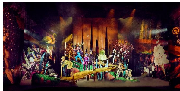
Charlie & Chokoladefabrikken