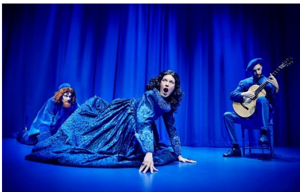
Leonora Christina – Sandhedens dronning