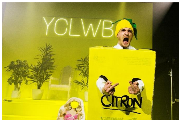
YCALWB