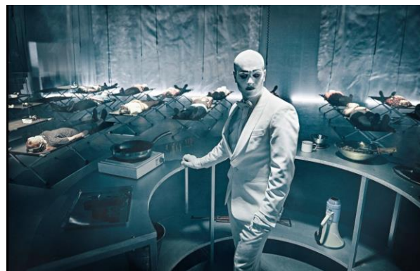
En fortælling om blindhed

Anmelderrost og sansestærkt lydteater af Christian Lollike i samarbejde med Sort/Hvid og Momentum - om en epidemi, hvis symptomer publikum fik lov til at gennemleve.