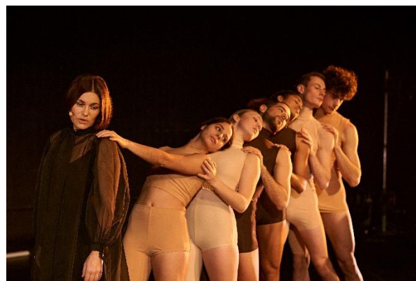
Vita Danica