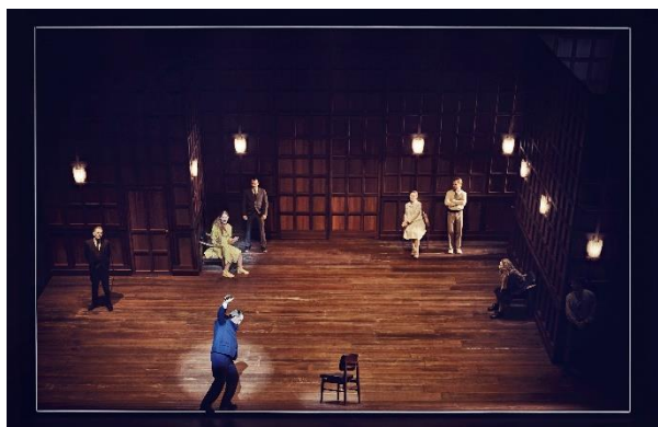
Kong Lear

Tidløs Shakespeare-klassiker i mesterinstruktøren Katrine Wiedemanns sikre hænder.